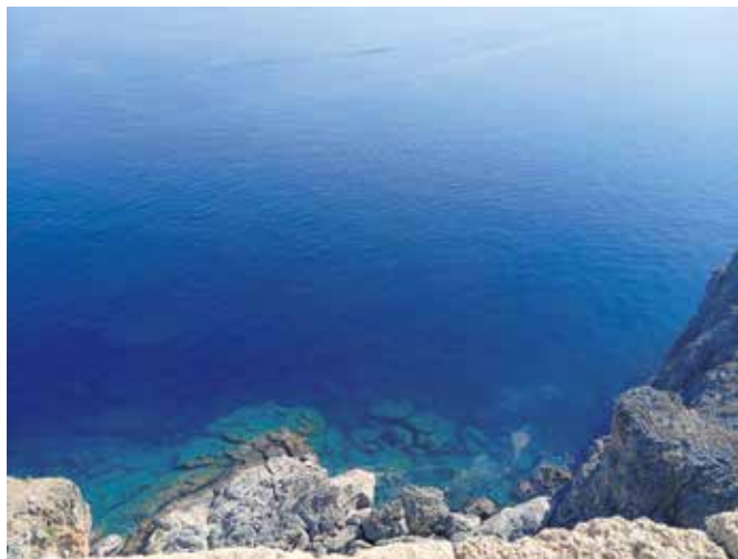
Rodos spada v jugovzhodni del Dodekanskega otočja, kjer se stikata Sredozemsko in Egejsko morje. Ta lega ustvarja izjemno ugodne razmere za čistočo in toploto vode.

Med sprehodom po mestu smo opazili še eno značilnost Rodosa – mačke. Te so povsod: lenobno poležavajo na soncu, prečkajo ulice in se stiskajo ob zidovih starih hiš. Na otoku zanje skrbijo prostovoljci, ki jim prinašajo hrano in postavljajo zatočišča. Postale so del vsakdana in skoraj simbol otoka – morda zato, ker tudi one živijo v ritmu Rodosa: počasi, svobodno in brez naglice.