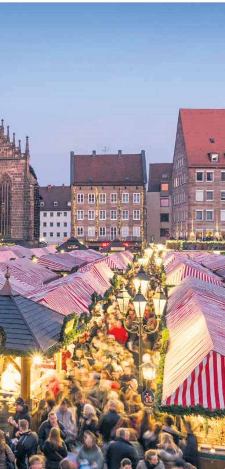
Sejem v Nürnbergu je romantična adventna klasika z dolgo tradicijo, a tudi dolgimi vrstami.

stojnic brez občutka naglice. Tovrstni sejmi so odlični za pare, ki iščejo sproščeno praznično idilo brez pretirane gneče. Dunaj, München ali Salzburg ponujajo kombinacijo prazničnega blišča in družinam prijazne infrastrukture. Na teh sejmih boste našli vrtiljake, drsališča,