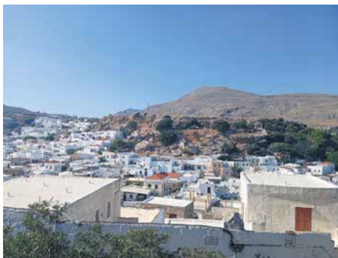
Bele hiše v Lindosu niso naključje, temveč del večstoletne arhitekturne tradicije grških otokov. Hiše so pobeljene z apnom, za zmanjšanje vročine, v higienske namene, zaradi estetike in identitete, ter so simbol čistosti in svetlobe.