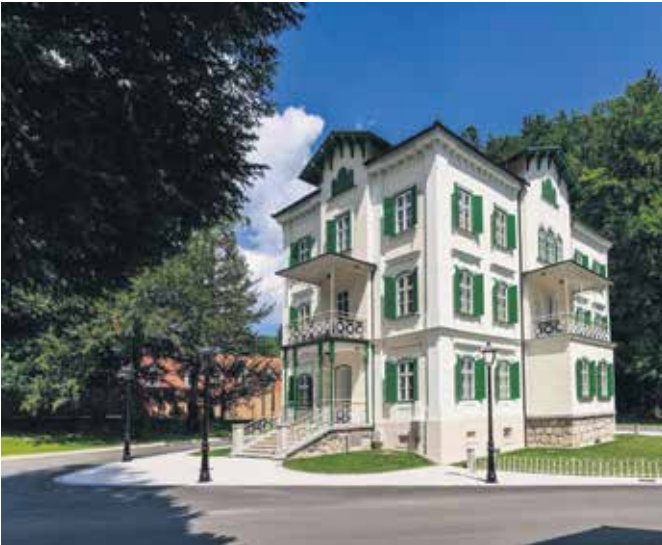
📍 Boutique hotel v Termah Dobrna, ki veljajo za najstarejše termalno zdravilišče pri nas

-Mg vključujejo storitve Medical centra Rogaška. Hkrati pa gostje, če ne koristijo tovrstnih paketov, obiskujejo Medical center tudi zaradi rituala pitja vode Donat kot pitne kure, zaradi menedžerskih pregledov in drugih storitev," sklene Mojca Korpar.