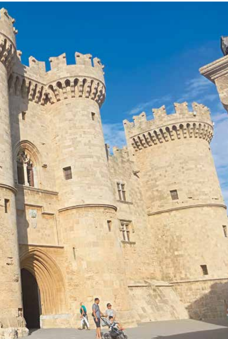
Palača velikih mojstrov. Impozantna utrdba viteškega reda svetega Janeza v središču starega mesta – danes eden simbolov Rodosa.