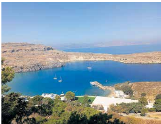
Z vrha akropole v Lindosu se odpira pogled na morje in zaliv svetega Pavla, eno najlepših razgledišč na Rodosu.