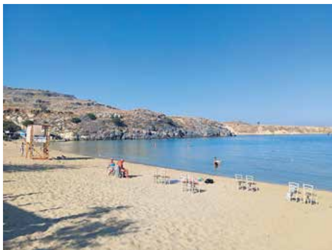
Konec oktobra je morje še prijetno toplo, plaže pa skoraj prazne – popoln čas za sprehod in kopanje brez gneče.