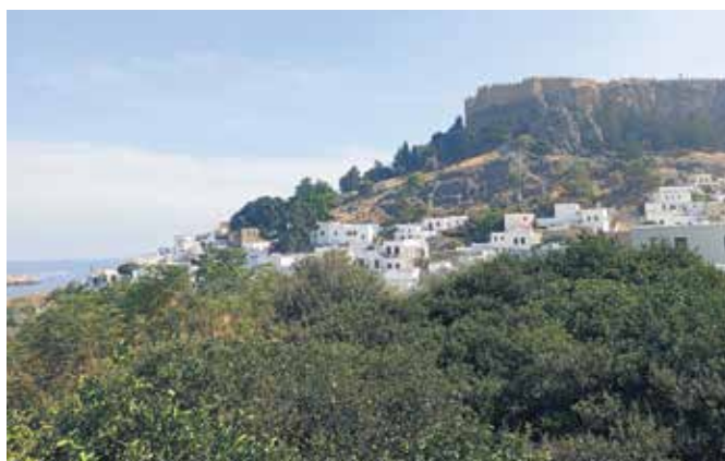
Bele hiše v Lindosu, zgrajene v tradicionalnem dodekanskem slogu, se spuščajo proti morju.