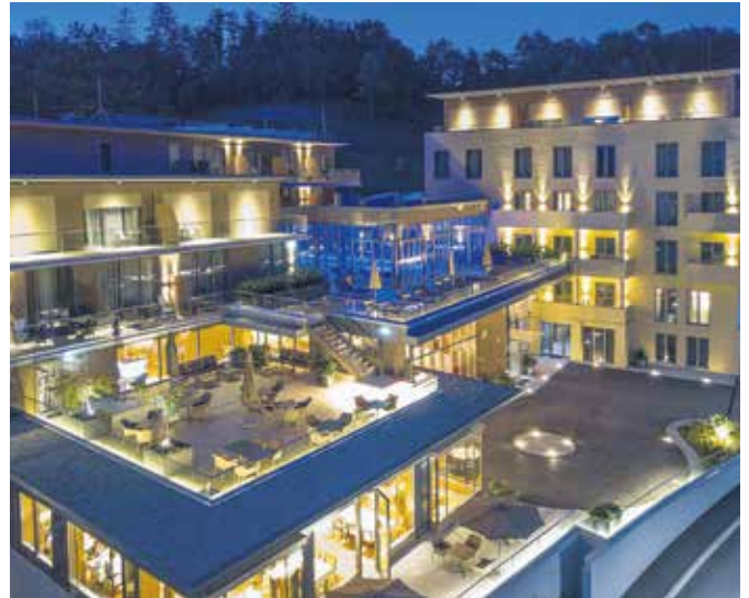
Atlantida Boutique Hotel v Rogaški Slatini se naslanja na dolgoletno tradicijo zdraviliškega turizma v kraju. 📍

To so le trije primeri, ki kažejo, kako se slovenska naravna zdravilišča in druga infrastruktura, ki se je razvila v zdraviliških krajih, vključujejo v zdravstveno turistični sistem Slovenije. "Posebno vrednost sloven-