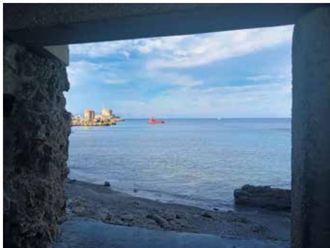
S kamnitega obzidja in s pogledom na morje

Otok ponuja mnogo tudi zunaj sezone. Sprehodili smo se skozi staro mestno jedro Rodosa (Old Town), eno najbolj ohranjenih srednjeveških mest v Evropi, in se ustavili v pristanišču Mandraki, kjer je po legendi stal znameniti Kolos z Rodosa, eno izmed sedmih čudes antičnega sveta – bronasti kip boga Heliosa, ki naj bi s po eno nogo stal na vsakem od vhodnih pomolov in pozdravljal ladje, ko so